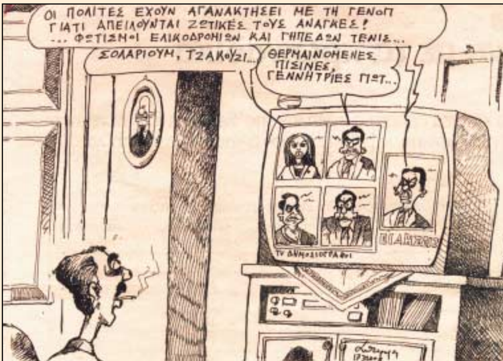
ΣΚΙΤΣΟ: Ανδρέας Πετρούλακης ΑΠΟ ΤΗΝ ΕΦΗΜΕΡΙΔΑ «ΚΟΣΜΟΣ ΤΟΥ ΕΠΕΝΔΥΤΗ»

Αλλά για να μην είμαστε άδικοι μαζί του, στο ίδιο άρθρο παραδέχεται ο κ. Μάνος πως είναι λάθος οι αγωγές και τα δικαστήρια εναντίον των απεργών και προτείνει ως μοναδικό τρόπο διευθέτησης του προβλήματος να βρεθεί πολιτική λύση.