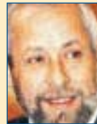
Υπ. Εξωτερικών: Θεόδωρος Κασσίμης