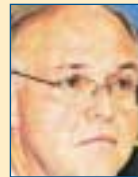
Υπ. Εξωτερικών: Πέτρος Δούκας