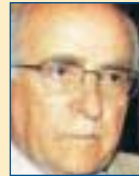
Υπ. Περιβ. Χωροστ. & Δημ. Έργων: Γιώργος Σουφλιάς