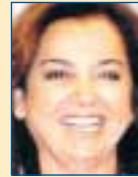
Υπ. Εξωτερικών: Ντόρα Μπακογιάννη