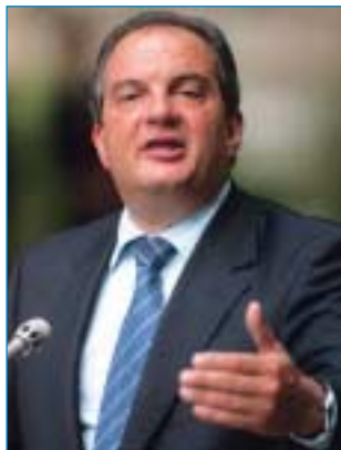
Πρωθυπουργός: Κώστας Καραμανλής

Οι εκλογές τελείωσαν και έφεραν μεγάλες ανακατατάξεις: Νίκη μεγάλη σε διαφορά, αλλά φτωχή σε βουλευτές για τη Ν.Δ., πλατιά χαμόγελα στην Αριστερά αλλά και μεγάλες λαϊκές απαιτήσεις για την επόμενη μέρα, μέχρι και είσοδο του ΛΑΟΣ στη Βουλή. Το μόνο που κάτι έχασε - εκτός από τις εκλογές, και την εσωτερική του... νιρβάνα - ήταν το ΠΑΣΟΚ, που αντιμετωπίζει κρίση ηγεσίας, πολιτικής και ταυτότητας.