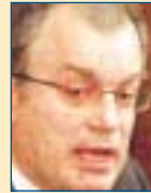
Υπ. Εθν. Άμυνας: Κων/νος Τασούλας