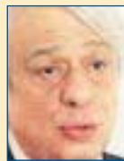
Υπ. Εσωτερικών: Προκόπης Παυλόπουλος