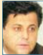
Υπ. Οικονομίας: Νίκος Λέγκας