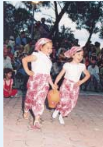
Γιορτή από το Β/Ν Αμαρουσίου.

Το προσωπικό των σταθμών θα συνεχίσει να προσφέρει τις υπηρεσίες του όσο καλύτερα μπορεί ελπίζοντας, όχι μά-