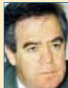
Υπ. Αγρ. Αναπτ. & Τροφίμων: Αλέξανδρος Κοντός