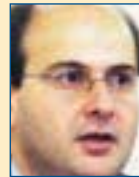
Υπ. Μεταφορών & Επικοινωνιών: Κώστας Χατζηδράκης