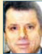
Υπ. Ανάπτυξης: Γιώργος Βλάχος