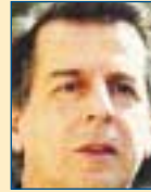
Υπ. Πολιτισμού: Μιχάλης Λιάπης