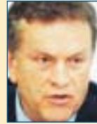
Υπ. Αθλητισμού: Ιωάννης Ιωαννίδης