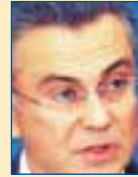
Υπ. Επικρατείας: Θεόδωρος Ρουσόπουλος