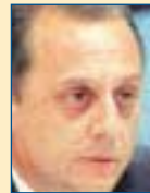
Υπ. Οικονομίας: Αντώνης Μπέζας