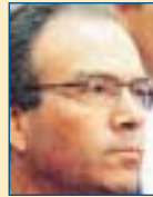
Υπ. Μακεδονίας-Θράκης: Μαργαρίτης Τζίμας