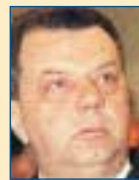
Υπ. Εσωτερικών: Παναγιώτης Χηνοφώτης