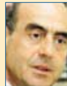
Υπ. Ναυτιλίας & Νησ. Πολιτικής: Γιώργος Βουλγαράκης