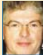
Υπ. Εθν. Παιδείας & Θρησκευμ.: Ανδρέας Λυκουρέντζος