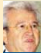
Υπ. Ανάπτυξης: Χρήστος Φλώκας