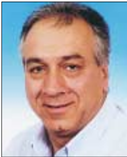
Γράφει ο Σ. ΖΙΖΗΛΑΣ Γ. Γραμ. ΠΑΣΥΠ/ΔΕΗ

ΜΑΖΙ ΜΠΟΡΟΥΜΕ ΝΑ ΠΕΤΥΧΟΥΜΕ - ΠΡΟΧΩΡΑΜΕ ΜΠΡΟΣΤΑ