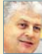
Υπ. Υγείας & Κοιν. Αλληλεγγύης: Γιωρ. Κωνσταντόπουλος