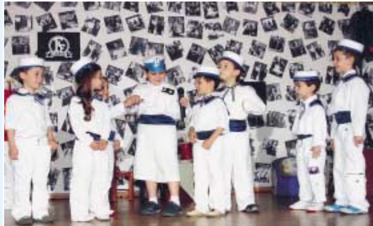
Γιορτή από το Β/Ν Καλλιθέας.

Τώρα, μετά από τέσσερα χρόνια λειτουργίας των σταθμών, μπορούμε να πούμε ότι δικαιωθήκαμε καθώς η αποτίμηση του έργου είναι θετική και αναγνωρίζεται ότι γίνεται σωστή και υπεύθυνη εργασία κατά κοινή ομολογία των γονιών οι οποίοι μεγάλωσαν τα παιδιά τους μέσα στους σταθμούς μας, έφυγαν ικανοποιημένοι