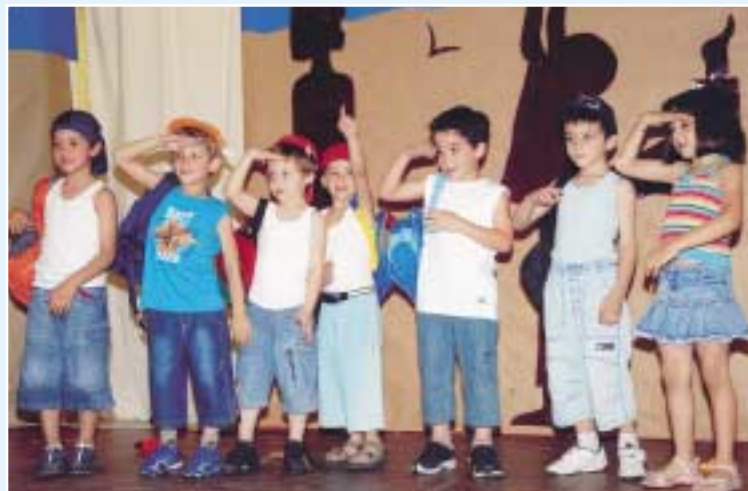
Γιορτή από το Β/Ν Περιστερίου.

και επιστρέφουν κάποιες φορές έχοντας έναν καλό λόγο και ένα «ευχαριστώ» για όλους εμάς που προσπαθήσαμε για το καλύτερο.