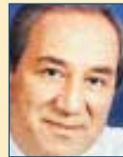
Υπ. Οικονομίας: Γιώργος Αλογοσκούφης