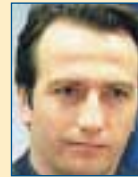
Υπ. Ανάπτυξης: Σταύρος Καλαφάτης