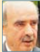
Υπ. Εθν. Άμυνας: Ευάγγελος Μείμαράκης