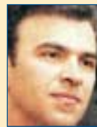
Υπ. Εσωτερικών: Χρήστος Ζώης