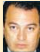
Υπ. Εθν. Παιδείας & Θρησκευμ.: Ευριπίδης Στυλιανίδης