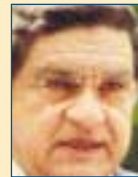
Υπ. Αποσχ. & Κοιν. Προστασίας: Βασίλης Μαγγίνας