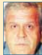
Υπ. Εσωτερικών: Αθανάσιος Νάκος