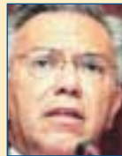
Υπ. Εξωτερικών: Ιωάννης Βαληνάκης