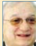
Υπ. Δικαιοσύνης: Σωτήρης Χατζηγάκης