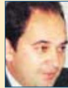
Υπ. Εθν. Άμυνας: Ιωάννης Πλακωιάτης