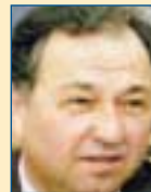
Υπ. Αγρ. Αναπτ. & Τροφίμων: Κώστας Κιλπίδης