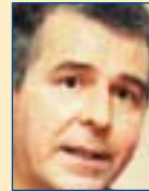
Υπ. Περιβ. Χωροστ. & Δημ. Έργων: Σταυρ. Καλογιάννης