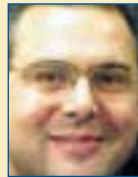
Υπ. Ναυτιλίας & Νησ. Πολιτικής: Πάνος Καμμένος