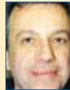
Υπ. Εθν. Παιδείας & Θρησκευμ.: Σπύρος Ταλιαδούρος