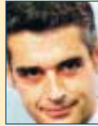
Υπ. Τουριστ. Ανάπτυξης: Άρης Σπηλιωτόπουλος